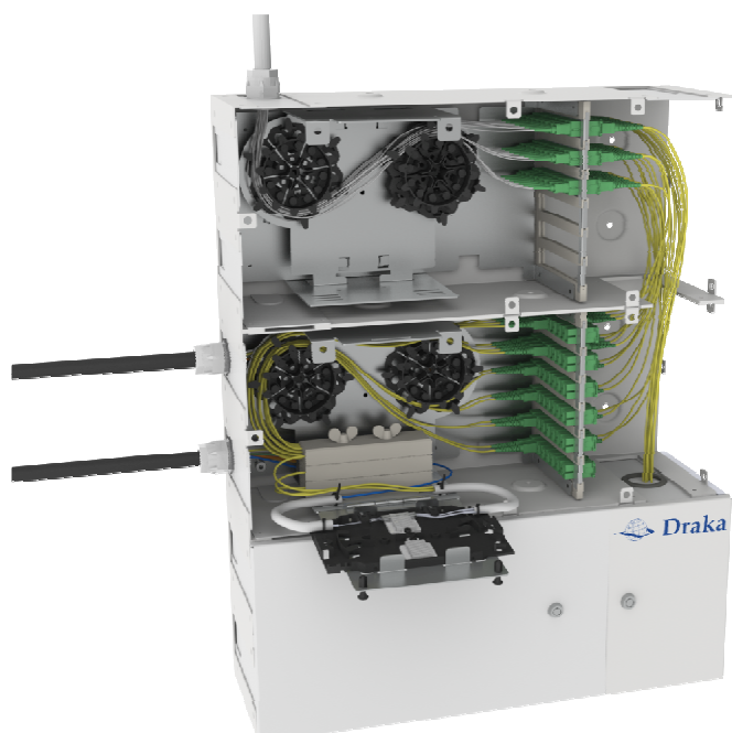
Photo : le boîtier modulaire mural de Draka - l'une des cinq nouvelles solutions de connexion pour immeubles - assure le raccordement entre les réseaux extérieur et intérieur. Modulaire, ce produit comporte des compartiments séparés et verrouillables pouvant être empilés à la verticale, et permettant d'effectuer des raccordements et des connexions croisées.

Draka, dont le siège social est établi à Amsterdam (Pays-Bas), est une société cotée sur Euronext qui réalise un chiffre d'affaires de 2 milliards d'euros et emploie 9 400 personnes dans le monde. Depuis 2008, les activités de Draka s'articulent autour trois divisions : Energy & Infrastructure, Industry & Specialty et Communications. Draka Communication est leader mondial dans le développement, la production et la vente de fibre optique, de câble et de solutions réseaux. Draka est présent dans 32 pays à travers l'Europe, L'Amérique du Nord, l'Amérique latine, l'Asie et l'Australie. Pour plus d'information, visitez www.draka.com/communications